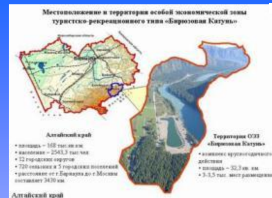
ОЭЗ «Бирюзовая Катунь»