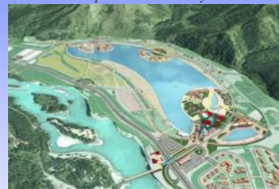
ОЭЗ «Алтайская долина»