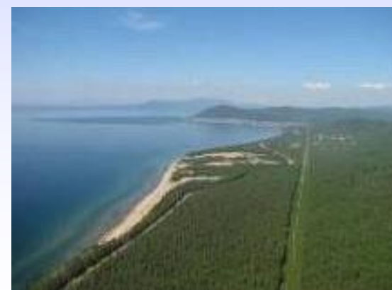
ОЭЗ «Байкальская гавань»