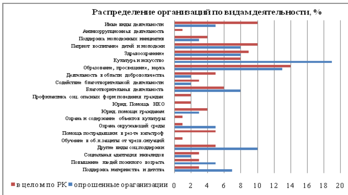
Рис. 2. Распределение СОНКО Республики Карелия по видам деятельности 2012 г. (данные Территориального органа Федеральной службы государственной статистики по Республике Карелия и социологического опроса)

Доминирующая часть (78%) опрошенных организаций подразумевают членство со средней численностью 181 чел., в 8 организациях членство отсутствует. Более чем в половине НКО численность членов составляет до 50 чел. (16 организаций), пятая часть (7 организаций) до 100 чел., по две организации до 200 чел. и около 400–500 чел., в одной организации – 3 тыс. чел.