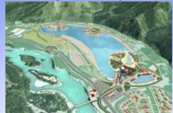
ОЭЗ «Алтайская долина»