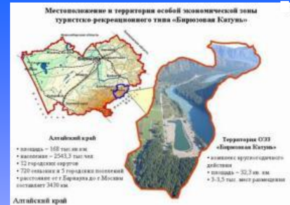
ОЭЗ «Бирюзовая Катунь»