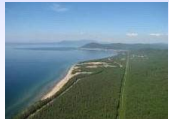
ОЭЗ «Байкальская гавань»