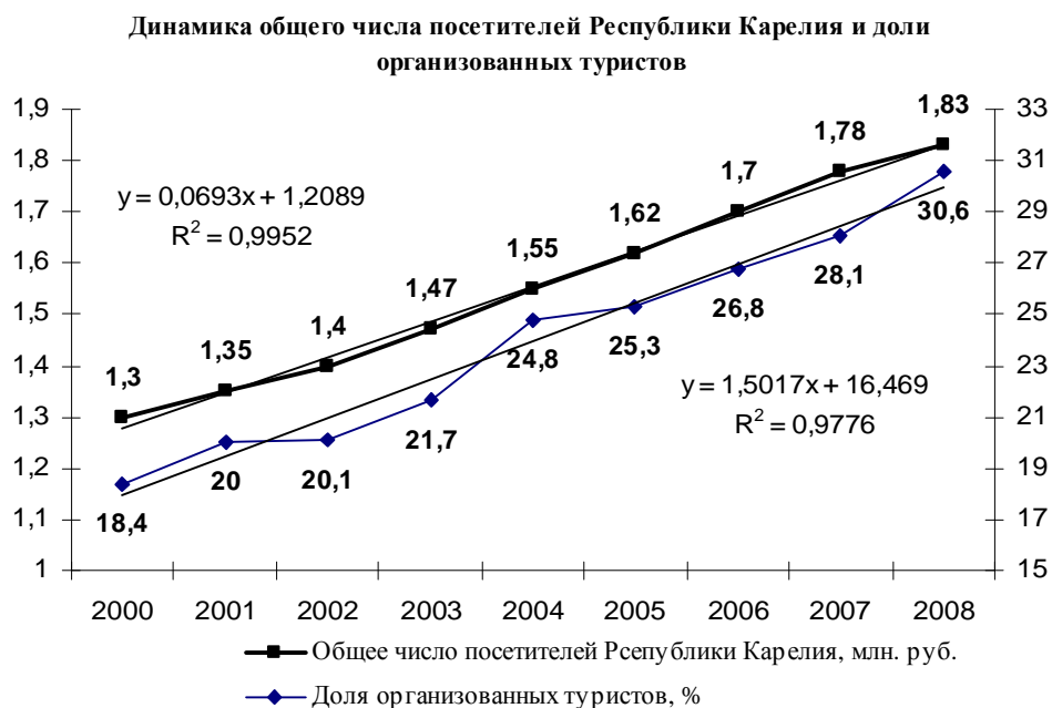
Рис. 1. Динамика общего числа посетителей Республики Карелия и доли организованных туристов

За исследуемый период 2000-2008 гг. наблюдаются достаточно высокие и устойчивые темпы роста туристского потока в республику, которые характеризуют данный рынок как перспективный (рис. 1.). В частности, динамика числа посетителей республики с туристскими целями в период 2000-2008 гг. характеризуется следующими показателями: 1,29 млн. туристов в 2000 г. и 1,83 млн. туристов в 2008 г. Рост количества посетивших республику туристов составляет 141,8 % или прирост в 41,8 %.