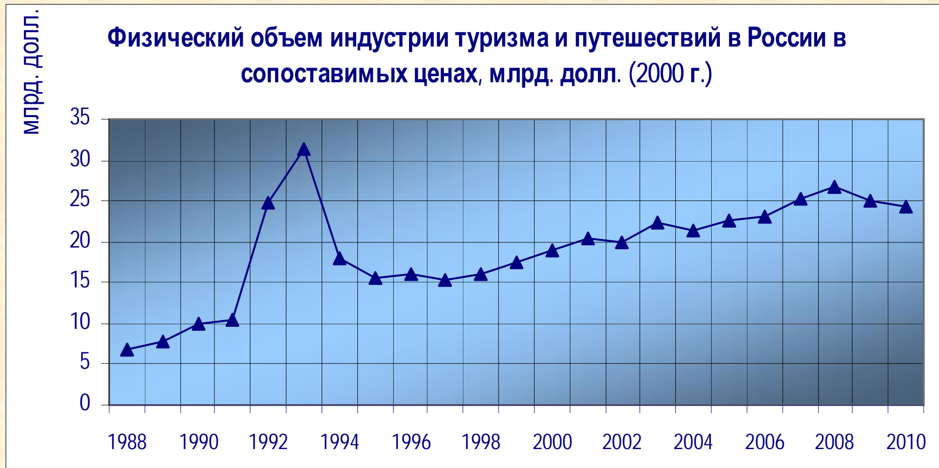
График составлен на основе статистических данных World Travel & Tourism Council (WTTC) ( http://www.wttc.org/ ).