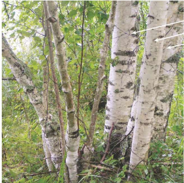
Рис. 38. Многоствольная, «гнездовидная» форма роста карельской березы естественного происхождения, представленная вегетативной порослью (А) или с примесью семенного потомства березы пушистой (указаны стрелкой) (Б). Ботанический заказник «Анисимовщина»