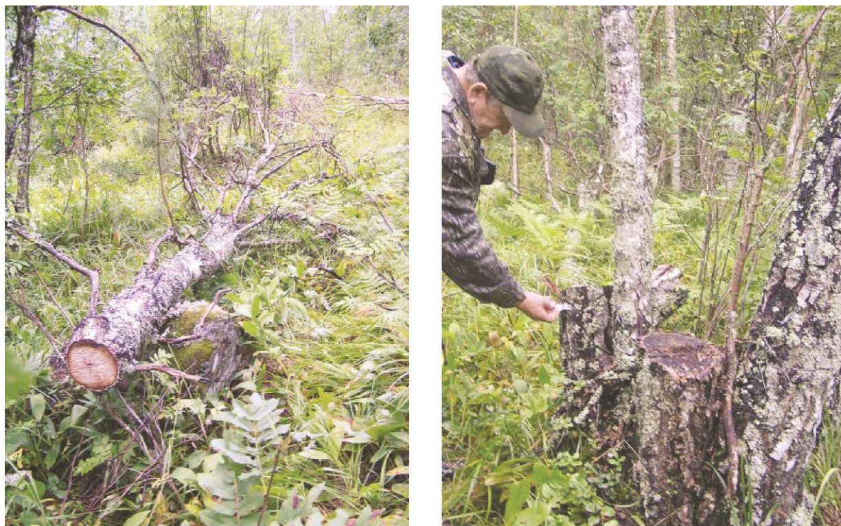
Рис. 40. Примеры браконьерской рубки карельской березы в ботаническом заказнике «Анисимовщина»