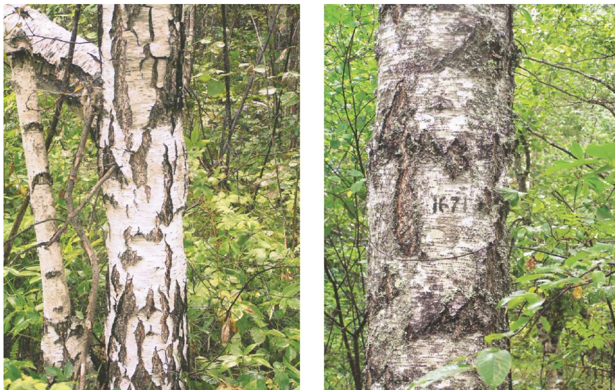
Рис. 41. Деревья карельской березы, требующие срочного размножения. Ботанический заказник «Анисимовщина»