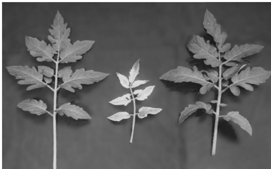
Рис. 1. Пятый лист растений томата в конце пререпродуктивного периода (37 суток от появления всходов). Варианты слева направо: контроль, 24 ч, 24 ч + ДРОП.

рогенности среди участков листьев по фотосинтетической активности. Аналогично нашим данным, большая вариабельность значений F_v/F_m наблюдалась у листьев томата с развивающимся хлорозом вследствие поражения грибковой инфекцией [20]. Реальный квантовый выход фотохимической активности ФС II ( \Phi ) тоже существенно снижался при действии круглосуточного освещения при постоянной температуре (рис. 2б). Значения биомассы и площади листьев были также значительно ниже, чем у контрольных растений (табл. 1).