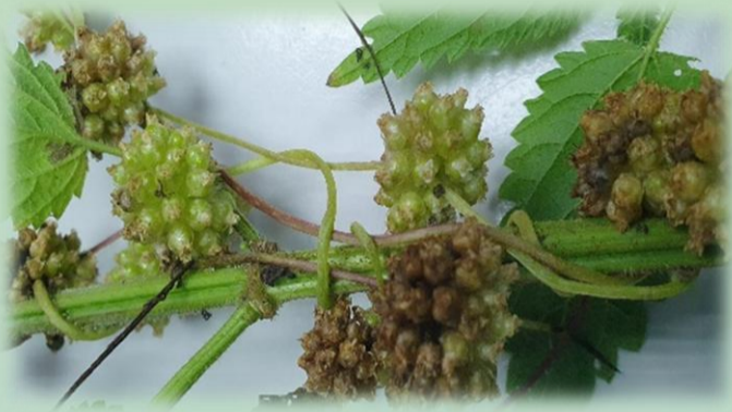
Повилика рода Cuscuta