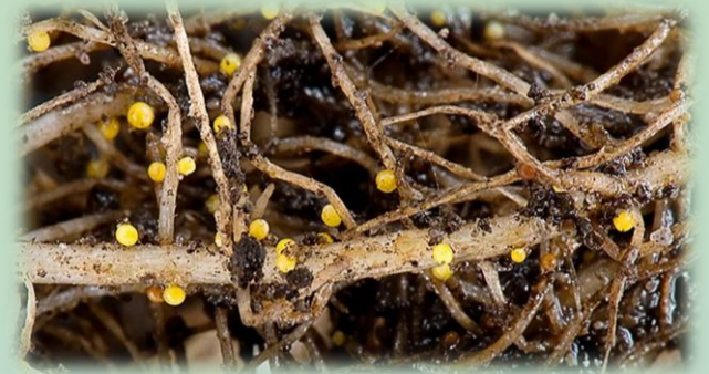
Золотистая цистообразующая картофельная нематода Globodera rostochiensis (Wollenweber)

Карантинные фитосанитарные зоны составляют 2589,9 га.