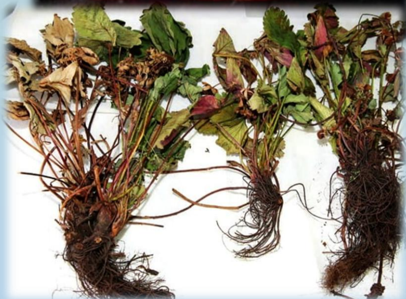
Симптомы повреждения и споровая масса антракноза