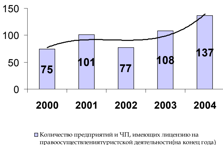
Рис. 3 Количество предприятий и ЧП, имеющих лицензию на право осуществления туристской деятельности (на конец года)

Общее количество предприятий и ЧП, имеющих лицензию на право осуществления туристской деятельности, с достаточной степенью точности моделируется полиномом 3 степени: