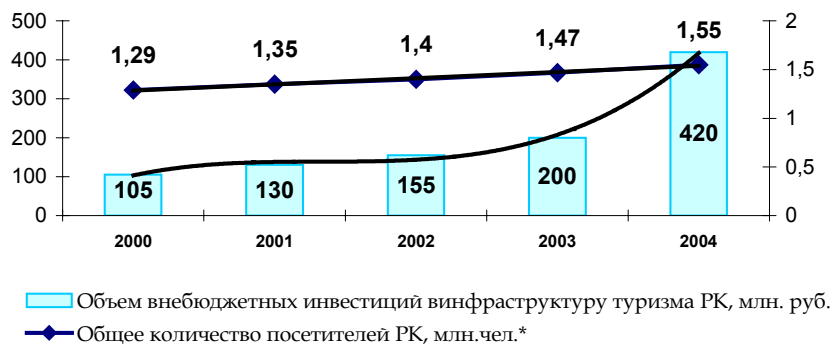
Рис.2 Динамика внебюджетных инвестиций и структуру туризма и общее количество посетителей РК

Денежный объем инвестиций с достаточной степенью точности моделируется полиномом 3 степени: