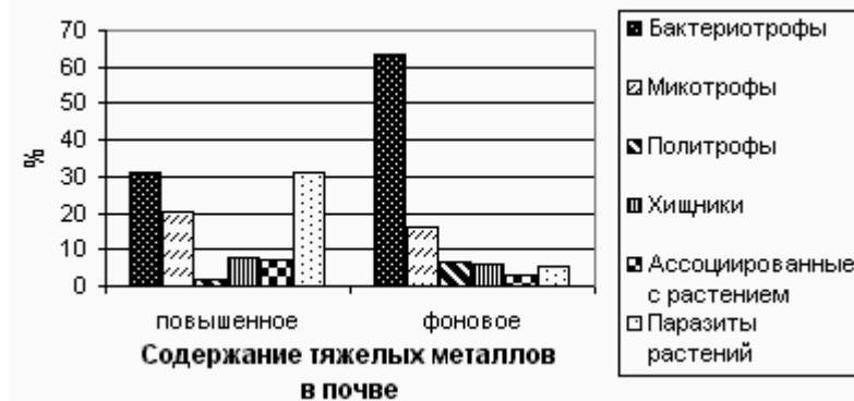
Рис. 2. Эколого-трофическая структура сообществ нематод луговых биоценозов с естественным повышенным содержанием тяжелых металлов в почве