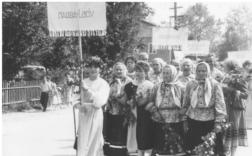
Рис. 1. Первый праздник «Древо жизни». Участники праздника из с. Ладва Подпорожского района Ленинградской области 1987 г.

Решение о проведении вепского праздника «Древо жизни» – ответ властей Ленинградской области на появившиеся в период гласности обращения представителей вепского народа в центральные органы власти. В них говорилось о лишении вепсов Ленинградской и Вологодской областей возможностей для их этнокультурного развития из-за ликвидации в конце 1930-х гг. вепской письменности, запрета на использование родного языка при проведении общественных и культурных мероприятий, о пагубных последствиях для будущего вепсов периода политики ликвидации «неперспективных деревень» и массовой регистрации их русскими по национальности в Ленинградской и Вологодской областях при проведении переписей 1970 и 1979 г. [Вепсы: модели этнической мобилизации 2007: 277–278]. Весьма критично ситуация с вепсами оценивалась и научной общественностью. Даже на фоне других малочисленных народов, оказавшихся, как и вепсы, в послевоенное время без собственных национально-территориальных образований, являвшихся в