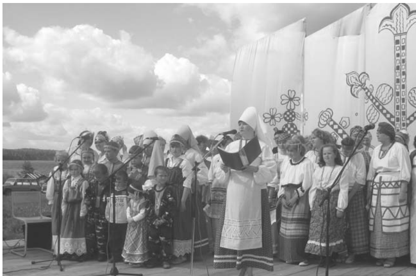
Рис. 2. Праздник «Древо жизни» в д. Панкратово Бабаевского района Ленинградской области 20.06.2009

В 2007 г. отмечалось 20-летие праздника «Древо жизни». Он назывался «Жили-были мастера». На празднике все могли увидеть работу народных мастеров, купить их изделия, состоялось чествование мастеров Винницкого края. Поздравить всех с юбилеем приезжал и губернатор Ленинградской области 11 .