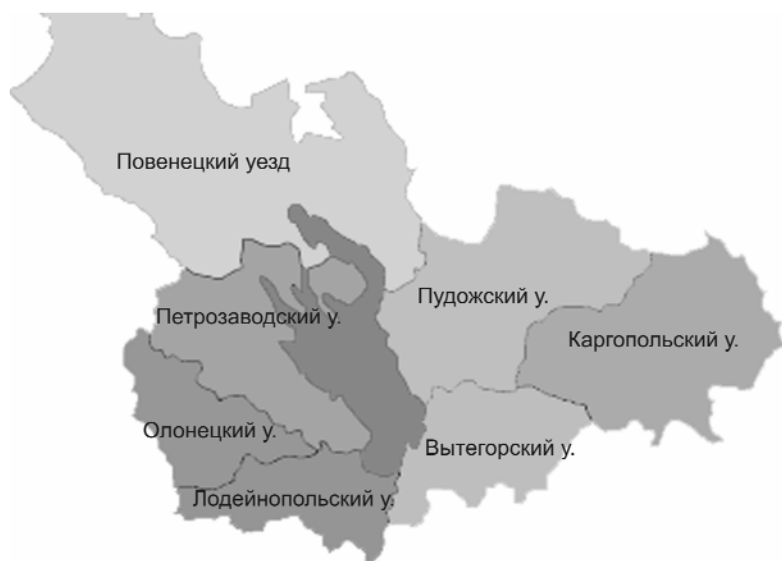
Карта Олонецкой губернии

Лодейнопольском уезде – сто с небольшим человек. Вепсы населяли Виницкую, Оштинскую, Подпорожскую, Шапшинскую и Шимозерскую волости Лодейнопольского уезда и Шелтозерско-Бережную волость Петрозаводского уезда. В Вытегорском, Повенецком и Олонецком уездах их насчитывалось всего 10 человек. Русские были расселены по губернии повсеместно, составляя абсолютное большинство в Пудожском, Каргопольском, Вытегорском, Лодейнопольском и Петрозаводском уездах [Покровская 1974: 102; Архив АН, ф.135, оп.2, № 627].