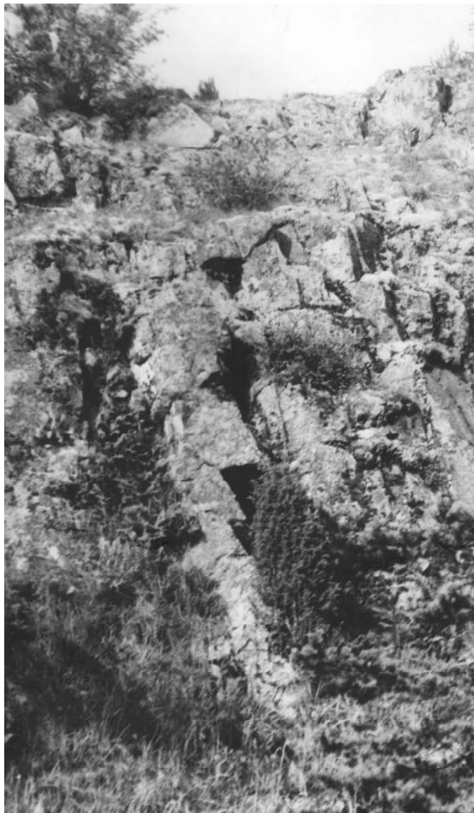
Рис. 3. Профильное изображение духа-«хозяина» острова с бородой 1988 г.