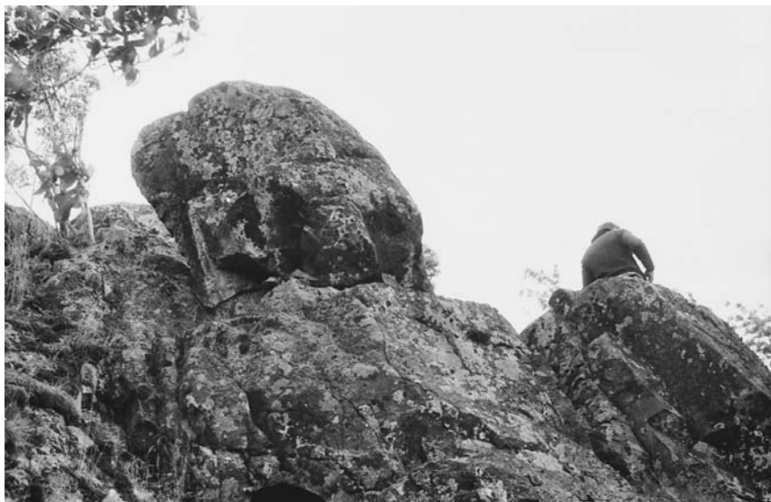
Рис. 2. Камень «череп» 1988 г.

Наименование «Радкольский» праздник получил по названию одноименного острова в Онежском озере, неподалеку от с. Сенная Губа и пристани Лонгасы. На каменном уступе этого острова с северной стороны есть камень природного происхождения высотой 2 м, имеющий внешнее сходство с головой человека. Каждый человек находит в особенностях форм камня либо то, либо другое сходство. Именно этот камень заонежане называли Радкольским идолом или богом грома и в честь него проводили праздник (рис. 1) [Ржановский 1924: С.102–103]. Подробное описание топографии острова и сохранившихся на острове артефактов приведено в работе И.В. Мельникова «Святыни древней Карелии» [Мельников 1998: 77–87]. Несколько к западу от Радкольского идола имеется еще один культовый камень, очень напоминающий череп человека с глазницами (рис. 2). Черно-белую фотографию этого камня из архива музея «Духовная культура Карелии» (КГПА), сделанную В.П. Ершовым, мы публикуем впервые. Недавно