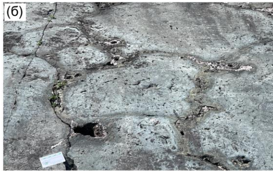
Рис. 1 (а, б) Подушечные базальтовые лавы медвежьегорской свиты ятулия, Сегозерская структура

Одним из примеров успешного решения этих задач являются результаты изучения Сегозерской структуры на Карельском кратоне. Вскрытые в её разрезе отложения ятулия были изучены комплексом методов, включавшем детальную документацию разрезов, петрографический, геохимический и изотопный анализ пород.