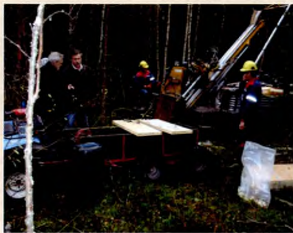
Геологоразведочные работы на месторождении тальково-карбонатных пород в Финляндии

В 2002–2003 гг. группа специалистов Института геологии Карелии в рамках проводимых в Финляндии геологоразведочных работ изучала опыт исследования тальково-карбонатных пород. Финские геологи с энтузиазмом отнеслись к обучению российских специалистов методам разведки месторождений тальково-карбонатных пород.