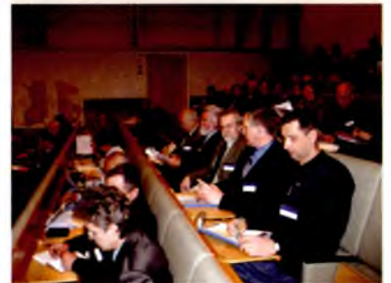
Семинар в г. Кухно (Финляндия)

торое внимательно следит за ходом и результатами работ российских и финских геологов.