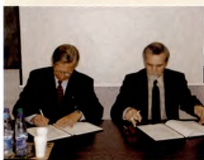
Подписание Меморандума о сотрудничестве, октябрь 2002 г.