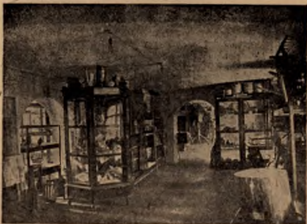
Карельский музей в 1926 г. 1926 г.

Общественный под'отдел революционный (1905—1917 г.г.) и под'отдел гражданской войны (интервенция белых в Карелии — 1919—1921 г.г.).