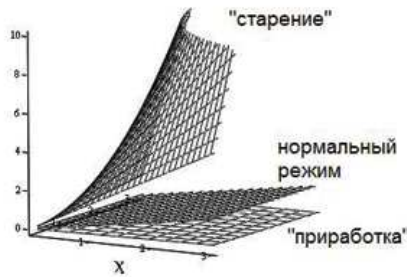
Рисунок 1. Оптимальная скорость разработки u_i^* для трех сценариев игры

Таким образом, для модели разработки невозобновляемых ресурсов удалось получить оптимальные решения для всех трех сценариев игры. Графическое изображение u_i^*(x, t) при фиксированном параметре масштаба \lambda = 1 и параметрах формы \delta = 1/2; 1; 2 приведено на рис.1.