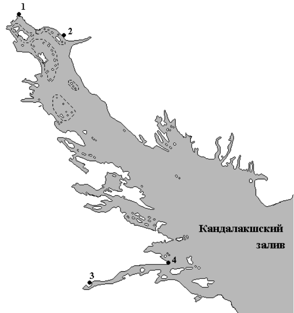
Рис. 1. Место исследования: 1 – г. Кандалакша, 2 – пос. Лувенга, 3 – пос. Чупа, 4 – мыс Карте́ш

Оценку видового разнообразия лишайников и особенностей распространения лишайников в условиях береговых скальных образований проводили отработанным на онежских берегах методом трансект [Фадеева, Сони́на, 2007]. Трансекты прокладывали от линии уреза воды до сформированного почвенно-растительного комплекса. Через 0,5 или 1,0 м (в зависимости от степени развития лишайникового покрова) закладывали учетные площадки (рамка 10 x 20 см) для описания состава и структуры лишайникового покрова. На каждой площадке отмечали число видов лишайников, проективное покрытие отдельных видов, общее и/или суммарное проективное покрытие видов в описании, экотопические характеристики. Для характеристик экотопов были использованы следующие показатели: расстояние от линии уреза воды (м), структура скального субстрата (степень структурированности поверхности породы, ее целостность или трещиноватость) (баллы от 1