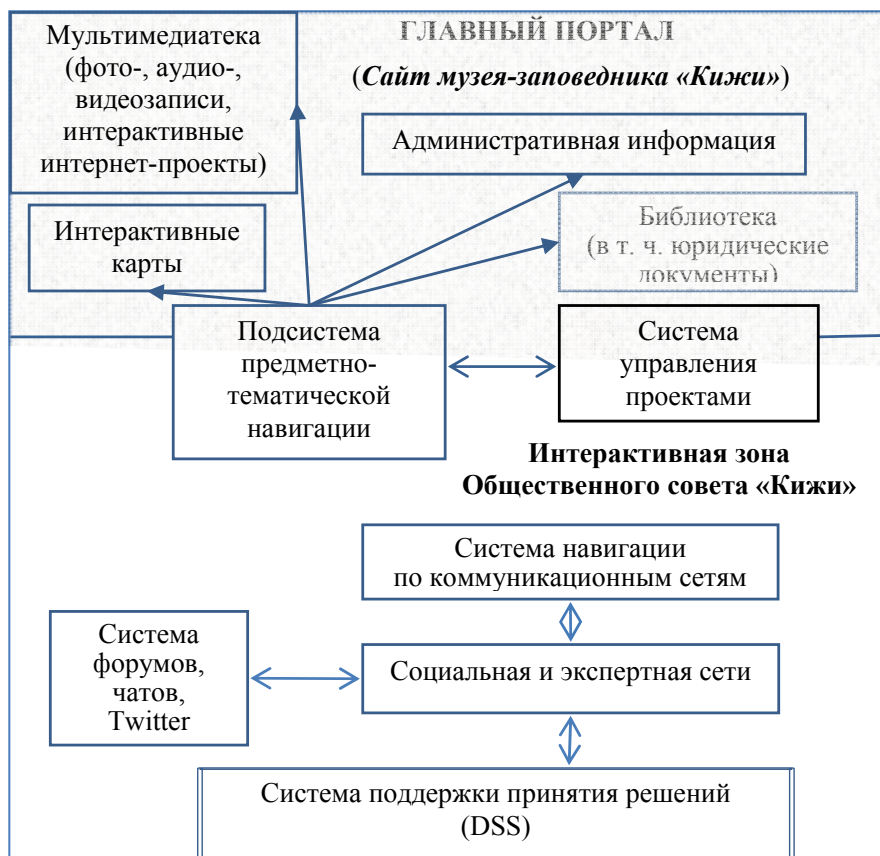
Рис. 3. Блок-схема портала ПУ ОВН «Кижский погост»