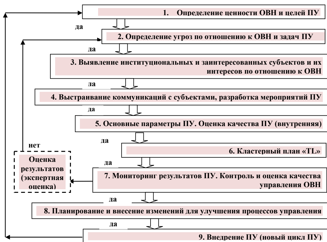
Рис. 4. Алгоритм разработки и реализации ПУ ОВН

– характеристику существующей системы охраны ОВН в РФ на основе законодательных и других методов государственной защиты и сохранения объекта (2);