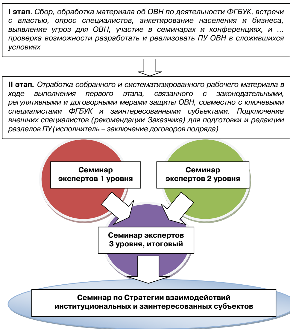
Рис. 1. Операционная схема по формированию концепции и содержания ПУ ОВН

таврации исторических элементов и конструкций объектов культурного наследия, связанная с консультациями по разработке и оценке соответствующих разделов плана управления.