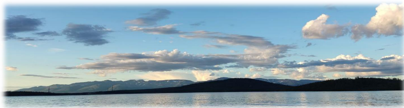
Вид на озеро Имандра и Хибины летом 2022 года. Фото сделано в 2 часа ночи