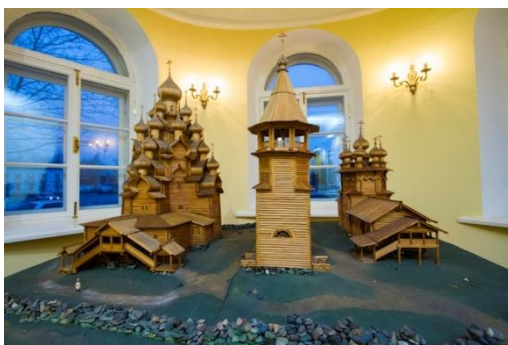
Макет Кижского историко-архитектурного ансамбля (01 июня по 09 ноября 2018)

Макет Кижского ансамбля выполнен архитекторами В.П. Моисеевым и И. И. Медниковым в масштабе 1:50.